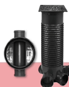
STUDNIE KANALIZACYJNE SC