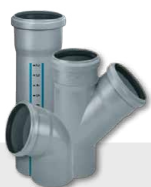
KANALIZACJA WEWNĘTRZNA NISKOSZUMOWA HT PLUS