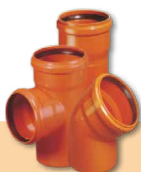
KANALIZACJA ZEWNĘTRZNA KG